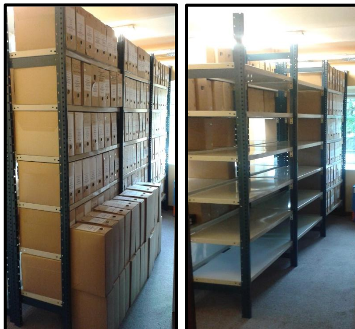
Papier archief vernietigen zorgt vaak voor een serieuze plaatswinst en een efficiënter depotbeheer (foto voor en na vernietiging).

En wat met de praktische invulling van archiefvernietiging, wijzigt deze dan ook? Ja, maar op een minieme wijze. In essentie valt de tweede stap, m.a.w. de goedkeuring van het Rijksarchief, weg. Vroeger waren twee selectielijsten geldig voor alle gemeenten, waardoor extra controle (en dus goedkeuring) wel noodzakelijk was. Aangezien nu het Rijksarchief zelf ook zetelt in de Selectiecommissie Gemeenten en de selectieregels per bestuur door hen worden goedgekeurd, valt deze extra goedkeuring weg. Dit zou in theorie het vernietigingsproces vlotter moeten laten verlopen.